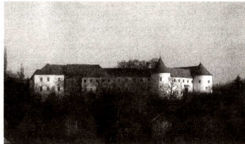
Grad Hrastovec v bližini Lenarta v Slovenskih goricah, kjer je bilo od junija do oktobra 1945 koncentracijsko taborišče OZNE.