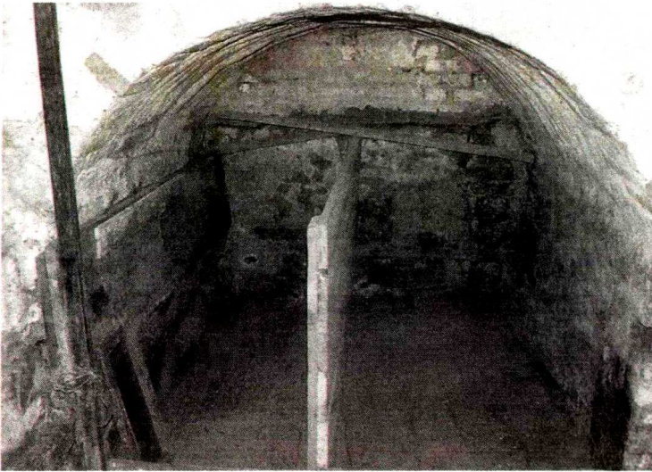
Prostor v kleti v Filovcih je bil samica za taboriščnike.